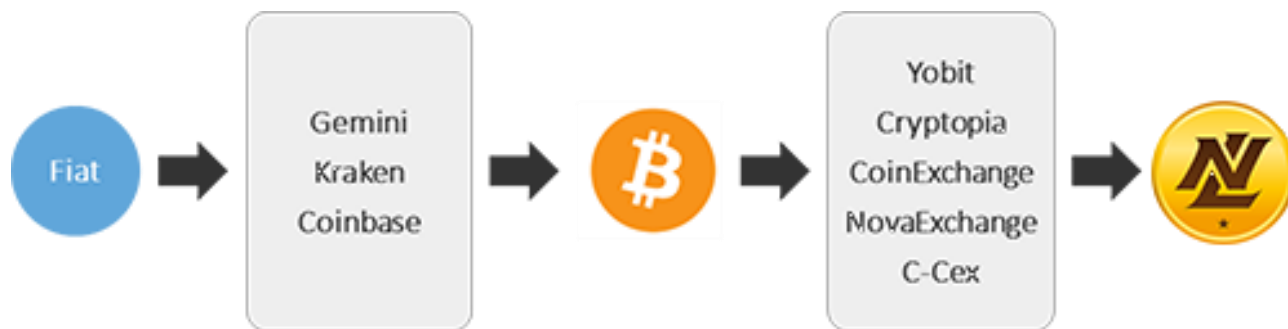
图 6.3: 如何从许可货币转至无极限币

此外，我们还与 CoinPayments 合作，允许我们的会员直接在我们的主要平台上使用比特币购买 NLC2。为了鼓励参赛，在加密梦幻体育或无极限梦幻体育平台，系统会在新会员注册时赠送免费的 NLC2。此外，为了推广我们的加密梦幻体育平台，在无极限梦幻体育举办的每次比赛都为会员提供了赢取免费 NLC2 的机会。