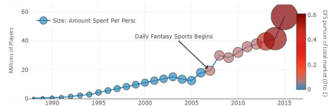
表 1: 梦幻体育市场的增长 5

无极限梦幻体育为全世界人们提供了体验梦幻体育乐趣的机会，而不会有目前其它梦幻体育平台的严格规定和高昂费用。通过使用无极限币（Symbol: NLC2），无极限梦幻体育是首个利用区块链技术的在线梦幻体育平台。这种加密货币的应用将使我们能够提供一种快速，安全和便宜的方法来资助和奖励玩家帐户，从而彻底改变了梦幻体育行业。